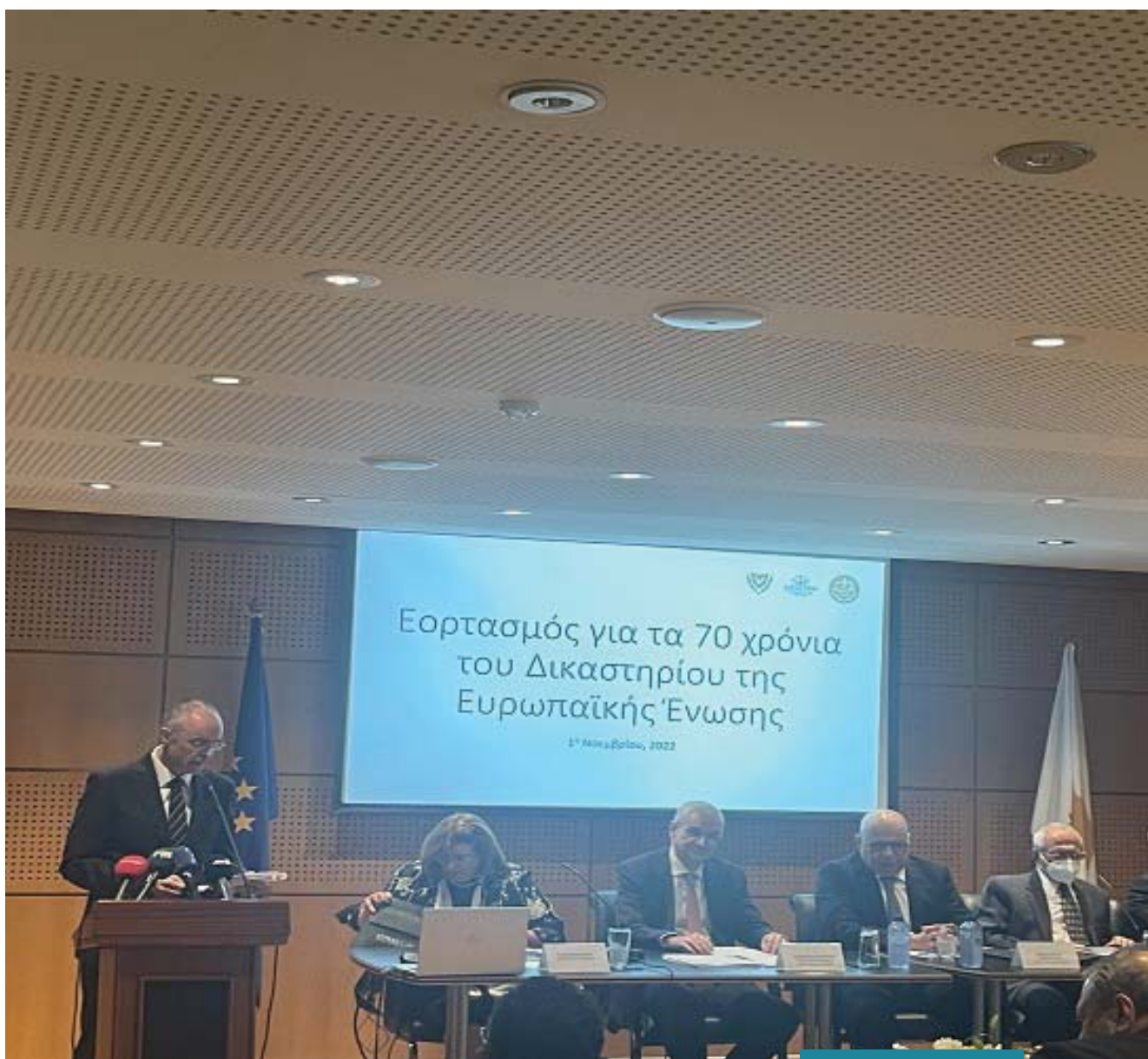
ΠΑΝΩ: Εορτασμός για τα 70 χρόνια του Δικαστηρίου της Ευρωπαϊκής Ένωσης, 1η Νοεμβρίου, 2022, Ανώτατο Δικαστήριο